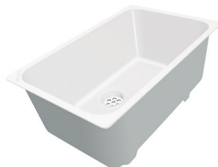
Weißer Wanne 8153 100

* nur in Kombination mit dem Zubehör 8644 101