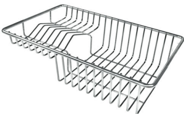
Tellerkorb aus Edelstahl 8100 303