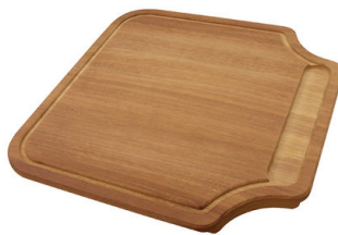
Schneidebrett aus Iroko-Holz 8646 000