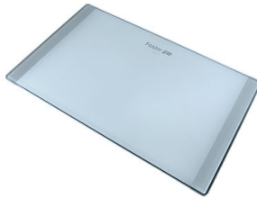
Schneidebrett aus Glas 8633 300